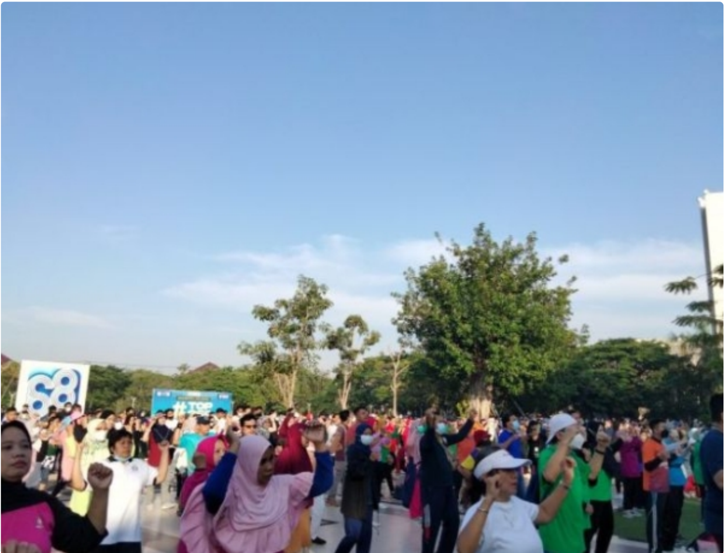
Senam Bersama

SURABAYA – Dalam rangka memperingati Dies Natalis dan Pendidikan Dokter Ke-109 tahun di Surabaya, Fakultas Kedokteran (FK) Universitas Airlangga